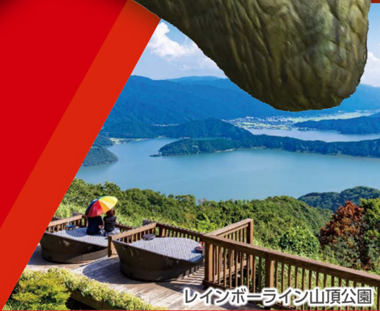
レインボーライン山頂公園